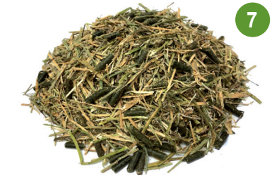
%35 برسيم بجودة درجة ثانية %35 تين شعير %30 مكثلات البرسيم %11 بروتين