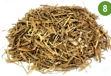
تين شعير - نوعان %3.7 بروتين %5 بروتين