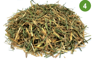
برسيم بلون أخضر وأصفر %17 بروتين