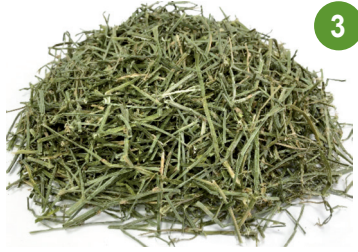
البرسيم أخضر اللون %70 بروتين