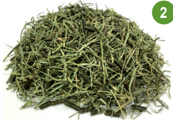
%70 برسيم أخضر اللون %30 مكثلات البرسيم %17 بروتين