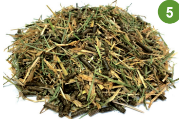
%70 برسيم بلون أخضر وأصفر %30 مكثلات البرسيم %17 بروتين