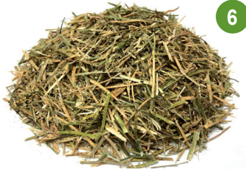
%60 برسيم بجودة درجة ثانية %40 تين شعير %11 بروتين