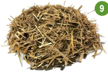
%70 تين شعير %30 مكثلات البرسيم %6.5 بروتين